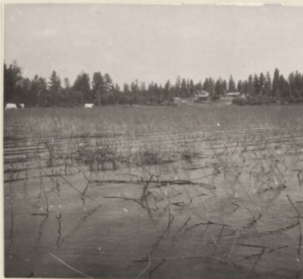
Fig. 1 Närbild av den förmodade nedslagsplatsen